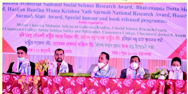
চিনামৰা মহাবিদ্যালয়ৰ ৰাষ্ট্ৰীয় বঁটা প্ৰদানৰ ৰাজহুৱা সভাৰ এটি মুহূৰ্ত